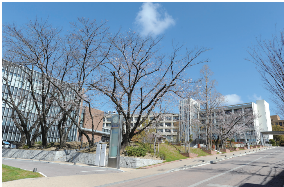
■名城大学正門アプローチ (平成 31 年 4 月)