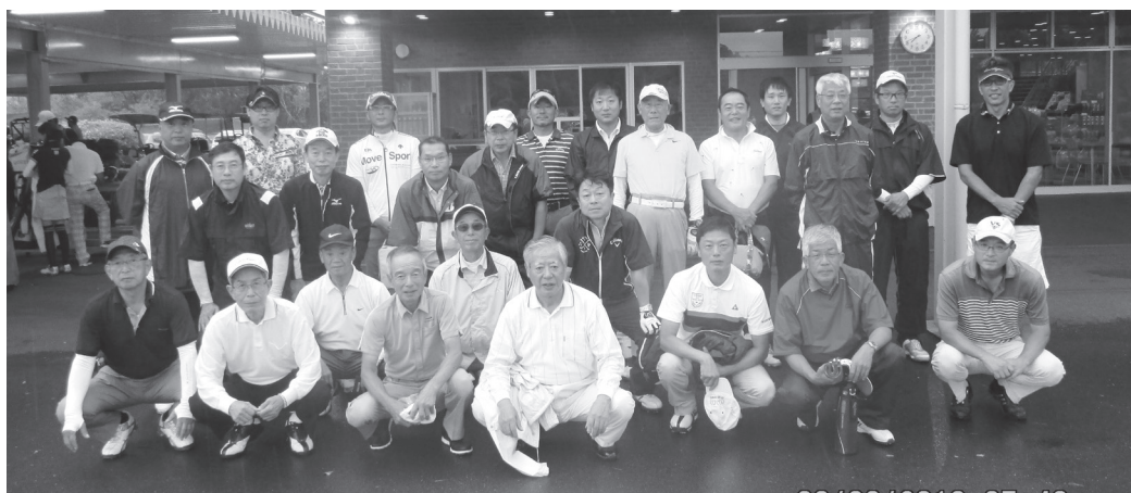
第 10 回機械会杯ゴルフ大会の参加の皆さん 2018年9月9日